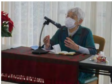
五十嵐先生からの クリスマスメッセージ