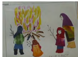
1・2月のカレンダー 「どんど焼き」