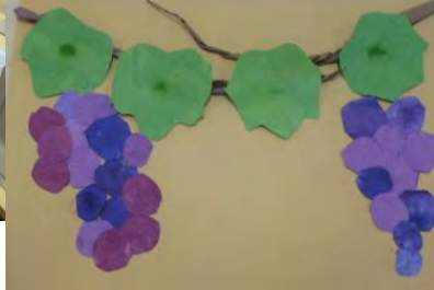
皆さんで染めた色合いが素敵です！