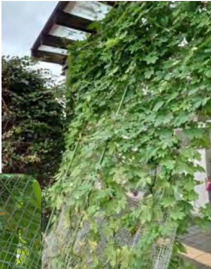
収穫したゴーヤは お昼ご飯の一品になりました。