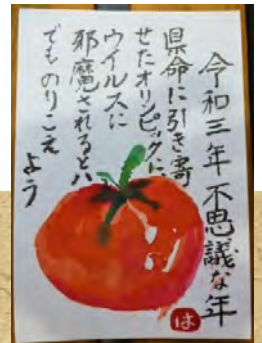
ご利用者さんの作品