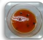
←スイカの種は、 チョコチップ！