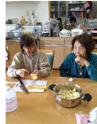
デイの方も一緒に、たけのこ掘りへ！！ 掘りたてをさっそく調理し、 たけのこご飯と煮物で美味しくいただきました♪ また、絵画のモデルとしても使用しました！

「小規模多機能ひまわり」(小規模多機能型居宅介護事業所ひまわり)は、 「デイサービスセンターひまわり」の2階にあります。登録定員は25名、 住み慣れたご自宅と地域で暮らし続けるために、『通い』(デイサービス： 1日の定員は15名)を中心に、『宿泊』(ショートステイ：1日の定員は 9名)や『訪問介護』(ホームヘルプ)の機能(サービス)を1つの事業所 で提供しています。専属のケアマネジャー(サービス計画作成担当者)が おり、また利用者さん3人に対して1名の職員を配置しています。 いつでもどこでも、顔なじみの職員が手厚くお手伝いすることを心がけ ていますので、安心して過ごすことができます。お問い合わせは左上まで。