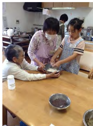
お昼はカレーライス、 おやつは柏餅を作りました！ 柏餅は子どもたちも一緒に 作ってくれました♪