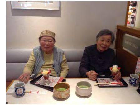
華屋与兵衛へおやつ外食に 行って来ました！ 皆さん、ご自分の食べたい 甘味を選んで、 大満足のご様子でした♪