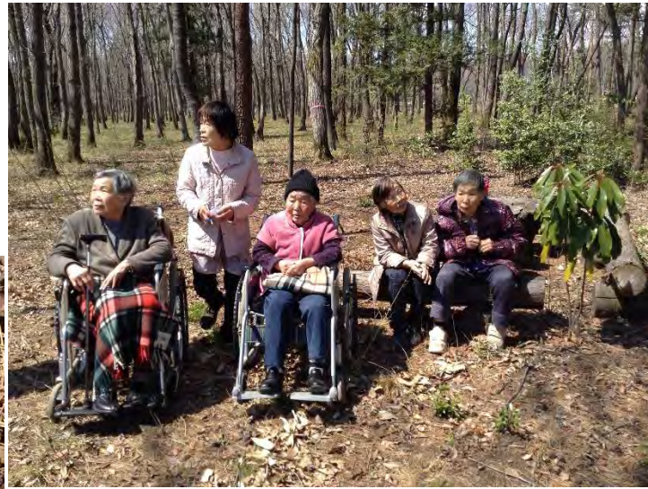
ご利用者の方の林へ、春を探しに行きました♪ 山桜やへびいちごの花が咲いていました！