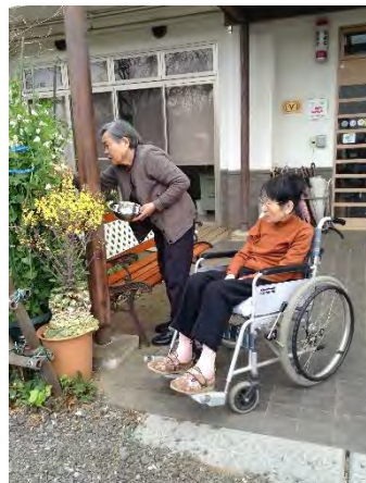
5月連休恒例の 昼食づくり&おやつ作り！