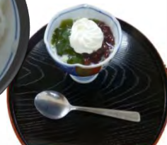
狭山茶の抹茶ゼリー