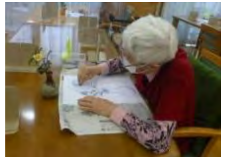
集中して制作に取り組みます