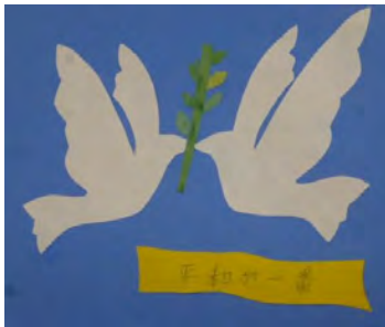
カレンダーづくり