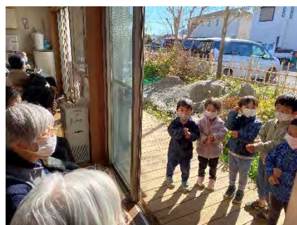
くま組（3-4歳児）来訪 ♪げんこつ山の～♪ と小さな手で披露！