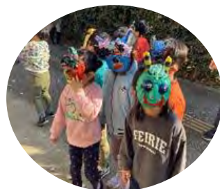
ぞう組の小鬼が 節分に来ました！